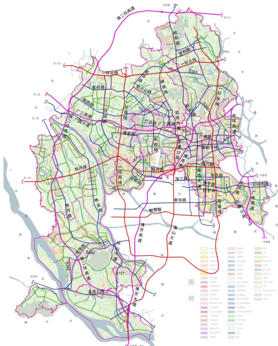
图 1-1 南海区现状快速路网图

目前，桂丹路沿线东段现状主要节点已完成立交化改造，西段多为菱形、分离式立交。东段现状节点佛山一环东线海八立交至佛山一环西线桂丹立交段立交节点平均间距约 3.5km，立交间距较远；部分立交高峰时段拥堵严重，如海八立交、桂江立交等。桂丹立交至终点段主要节点为菱形立交、分离式立交，节点距离较远，对两侧的隔离作用大，且沿线平面交叉口、地块出入口众多。